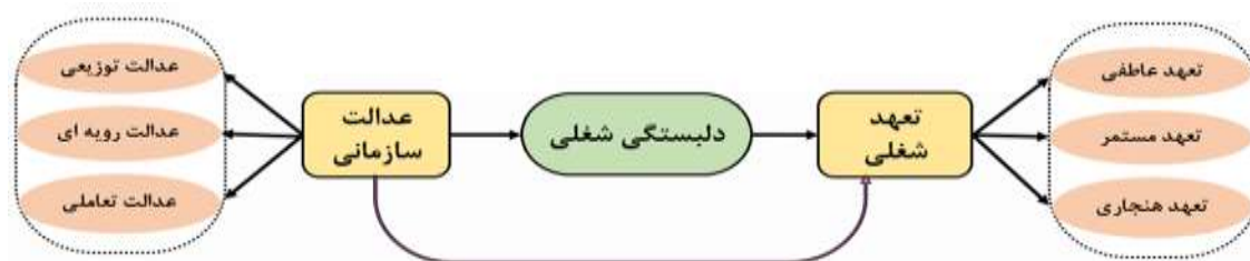
شکل ۱. مدل مفهومی پژوهش؛ روابط بین عدالت سازمانی، دلبستگی شغلی و تعهد شغلی (نویسندگان مقاله)

ارتباط متغیرهای عدالت سازمانی و تعهد شغلی با نقش واسطه‌ای دلبستگی شغلی کارکنان در شکل ۱ در قالب مدل مفهومی پژوهش نشان داده شده است. بنابراین با توجه به مدل مفهومی پژوهش، محققان در پی آزمودن فرضیاتی به شرح ذیل بودند: اول اینکه، بین عدالت سازمانی و تعهد شغلی کارکنان فدراسیون‌های ورزشی، رابطه معنادار وجود دارد؛ دوم